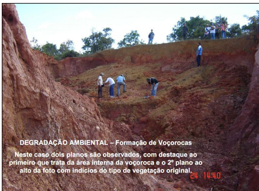
Ilustração 4. Voçoroca em Formosa - GO. Foto: Valdir Steinke (2008)

Sobre isso, é preciso ressaltar que o professor, ao utilizar uma fotografia em sala, deve conhecer o tema abordado para possibilitar a leitura da mensagem que deve ser transmitida por meio da imagem. Uma fotografia muitas vezes não transmite uma mensagem “por si mesma”, é necessário traduzir seu conteúdo, expor as diferentes leituras que podem ser feitas. Na ilustração abaixo, temos que o primeiro plano se sobressai onde identificamos as feições degradadas com nitidez, deixando à mostra o perfil do solo e ausência de horizonte. A leitura da paisagem vai variar de acordo com o nível de conhecimento de quem a interpreta, o que torna imprescindível para a Geografia, que os elementos a serem analisados estejam bem delimitados para que a fotografia seja melhor explorada em sala de aula.