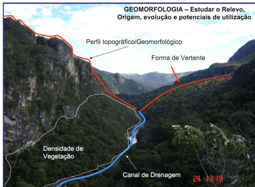
Ilustração 1. Parque Nacional da Chapada dos Veadeiros Foto: Valdir Steinke (2009)

possibilitando aos alunos um olhar mais crítico sobre diferentes abordagens na Geofotografia.